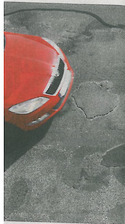
Výtkov nebudú je aj nec cestnýc

ónov eur z vlastného rozpočtu. „V roku 2018 predpokladáme aj začatie modernizácie cesty Malacky - Rohožník, ktorej rozpočet je 7 029 882,22 eura bez DPH a investícia bude spolufinancovaná zo zdrojov EÚ,“ informuje hovorkyňa kraja Lucia Forman.