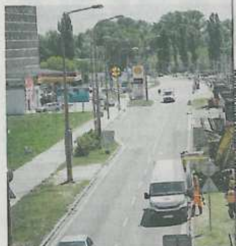
Zrekonštruovaná električková trať vytvára pr